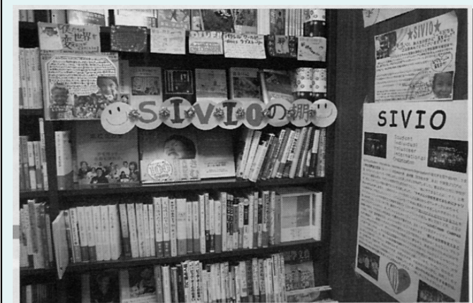
学生が品揃えしている SIVIO の棚

関西学院大学生協上ヶ原キャンパスのKGFフォーラム店は、昨年のリニューアルで書籍売場を100坪に増床したが、これに合わせて光和コンピューターのASPシステム「Book Answer」を導入し、このほど組合員が店内在庫をWeb上で検索して注文できるサービスを開始した。 同大学生協の店舗は上ヶ原のKGFフォーラム店と、理工学部と総合政策学部のある神戸三田キャンパス店がある。学生は上ヶ原キャンパスに1万6000人、神戸三田キャンパスに4000人が通っている。